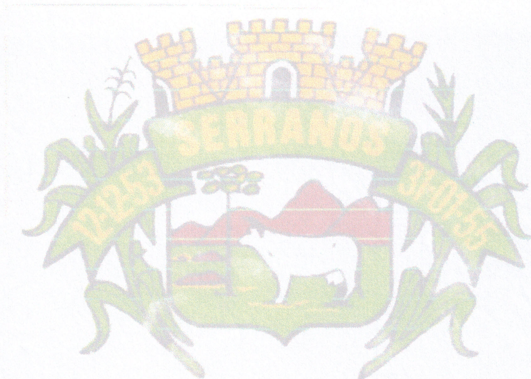
Marcelo Azevedo Carvalho Prefeito Municipal